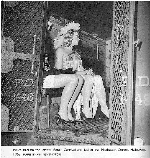
Police raid on the Artists' Exotic Carnival and Ball at the Manhattan Center, Halloween, 1962.

Stonewall era un bar miserable situado en el número 53 de Christopher Street, en el corazón del Greenwich Village, Nueva York. Era un local sin agua ni permiso, sin embargo los mafiosos que lo gestionaban corrompían a los policías para que llamara antes de las incursiones y para que éstas pasaran muy pronto por la noche, cuando todavía no estaba lleno de clientes. Era uno de los pocos lugares de encuentro de las personas trans y queer, además de ser frecuentado principalmente por personas afroamericanas o latinas; los dueños hacían la vista gorda sobre la presencia gay en el lugar, así que lograban mayores ganancias. En la noche del 28 de junio 1969 un grupo de policías se presentó sin avisar alrededor de la 1:30 de la noche y empezó a detener a quienes se encontraban sin documentación o no había respetado las leyes sobre el “travestismo” llevando vestidos del “sexo opuesto”, entonces principalmente personas trans, lesbianas butch (masculinas) y drag queen, muchas de ellas negras. Un grupo de personas empezó a agruparse fuera del local y alguien empezó a gritarle a los policías.